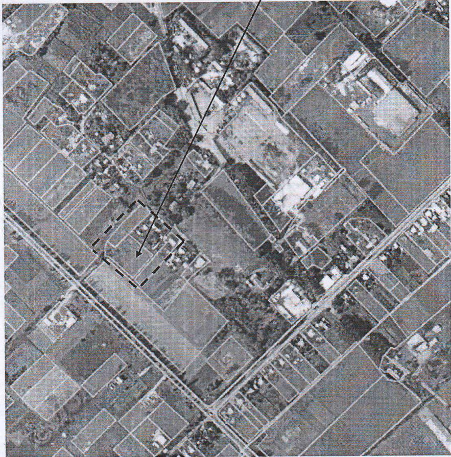
Схема з зазначеним контуром межі проектних робіт обмеженого вул. Соборна (Т-0405) та вул. Центральна в селі Чумаки Чумаківської сільської ради з зазначеним кадастровим номером окремої земельної ділянки в межах ДПТ - 1221488000:03:001:0563

Начальник управління містобудування, архітектури, житлово-комунального господарства, будівництва та інфраструктури Дніпровської РДА